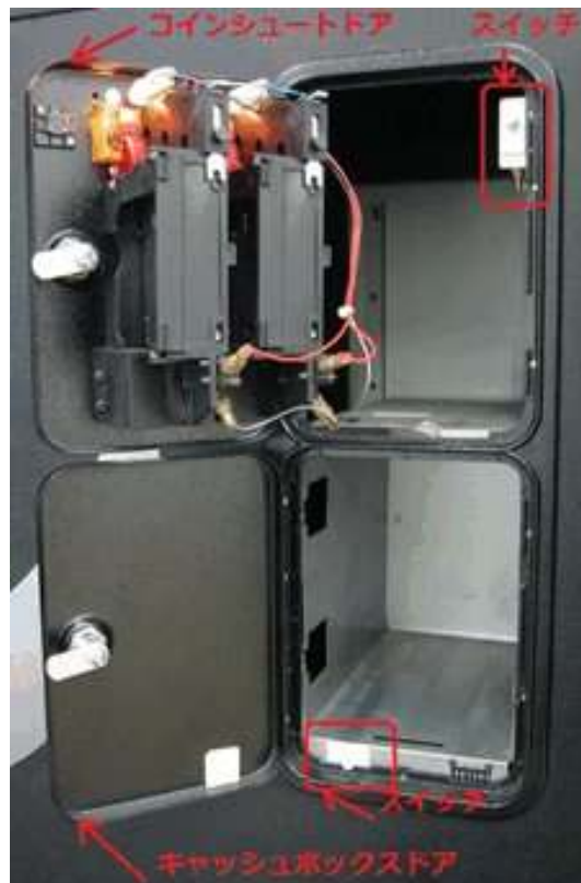
写真 Avanti;コインドア内側にあるスイッチ